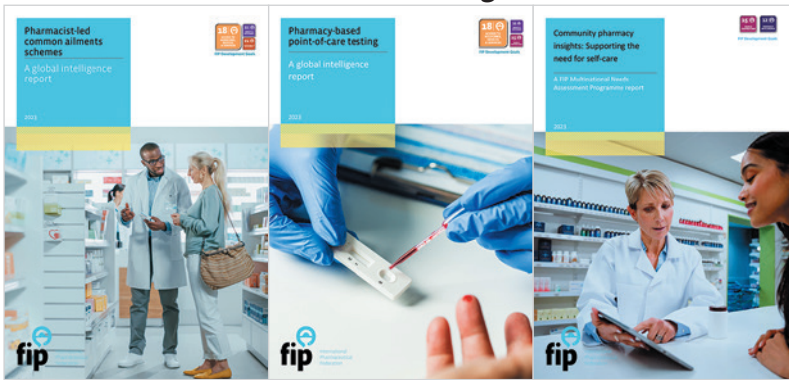
Información global sobre intervenciones de autocuidado en farmacias, mejores prácticas, barreras y factores facilitadores.