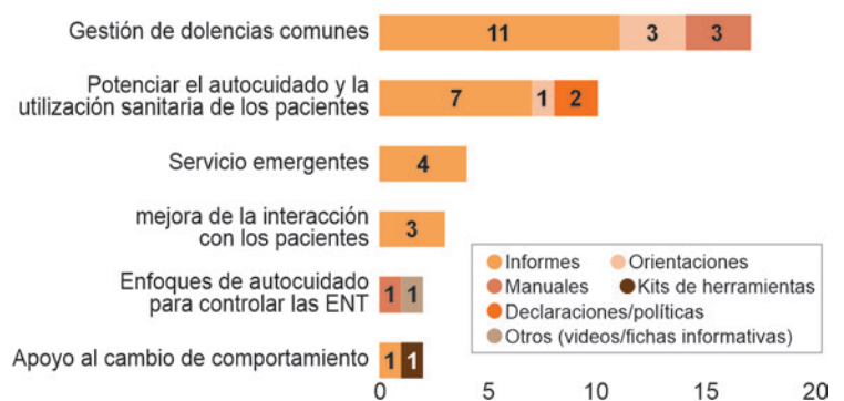
Figura 2: Resultados tipos dentro de cada tema (desglose por formato; sin incluir CPD Bites)