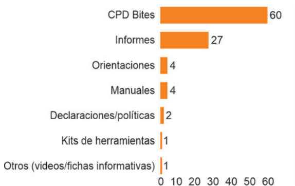
Figura 1. Distribución de los resultados del FIP por tipo (n=99)