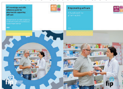
Recursos prácticos destinados a dotar a los químicos farmacéuticos de las herramientas y los conocimientos necesarios para promover el autocuidado entre los pacientes.