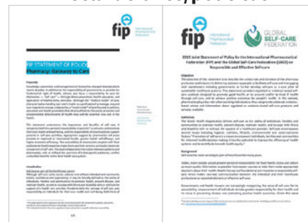
Reconoce el papel clave de los químicos farmacéuticos en la prestación de autocuidado y aboga por el reconocimiento y el apoyo a los químicos farmacéuticos.