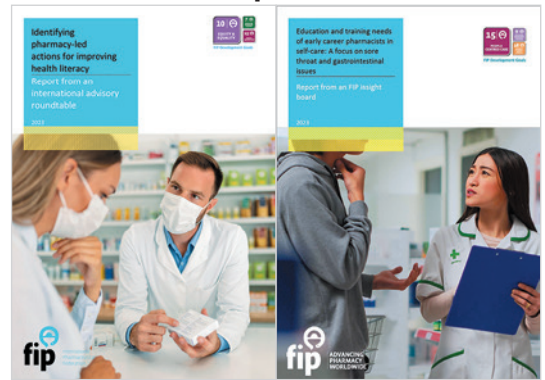
Debate de expertos y recomendaciones sobre prácticas de autocuidado, alfabetización sanitaria y necesidades de educación y formación.